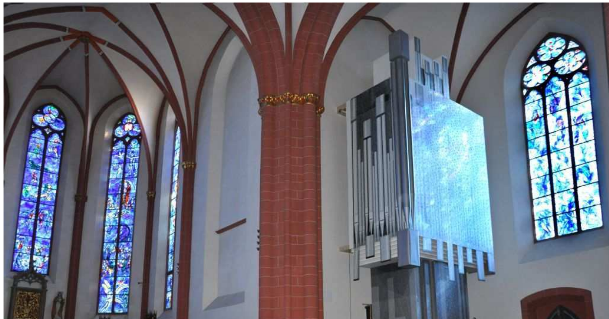
Das „Phantom der Orgel“ in St. Stephan

Mainzer Domchor singt für die neue Orgel in St. Stephan