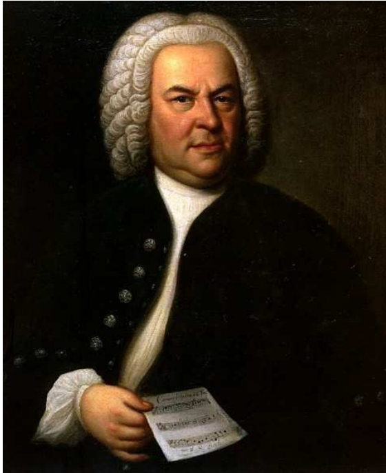
Johann Sebastian Bach

Klangvolle Gratulation zum 75. Geburtstag von Karl Kardinal Lehmann