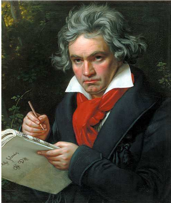
Ludwig van Beethoven (1811-1811)

Chöre am Mainzer Dom zu Gast beim „KlangFest Bad Ems“