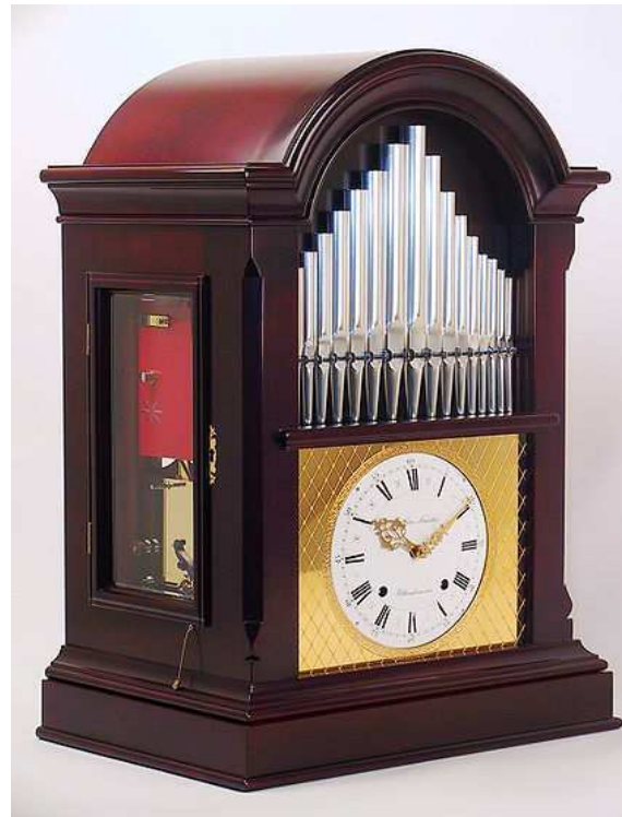
Tischflötenuhr mit komplettem Flötenwerk