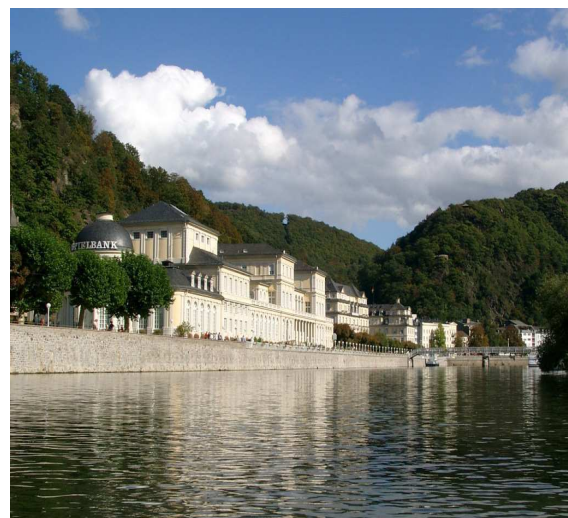
Kurhaus Bad Ems