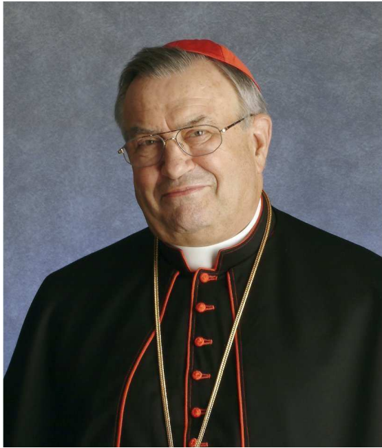
Karl Kardinal Lehmann

Kardinal Karl Lehmann liebt Musik – und die Stille